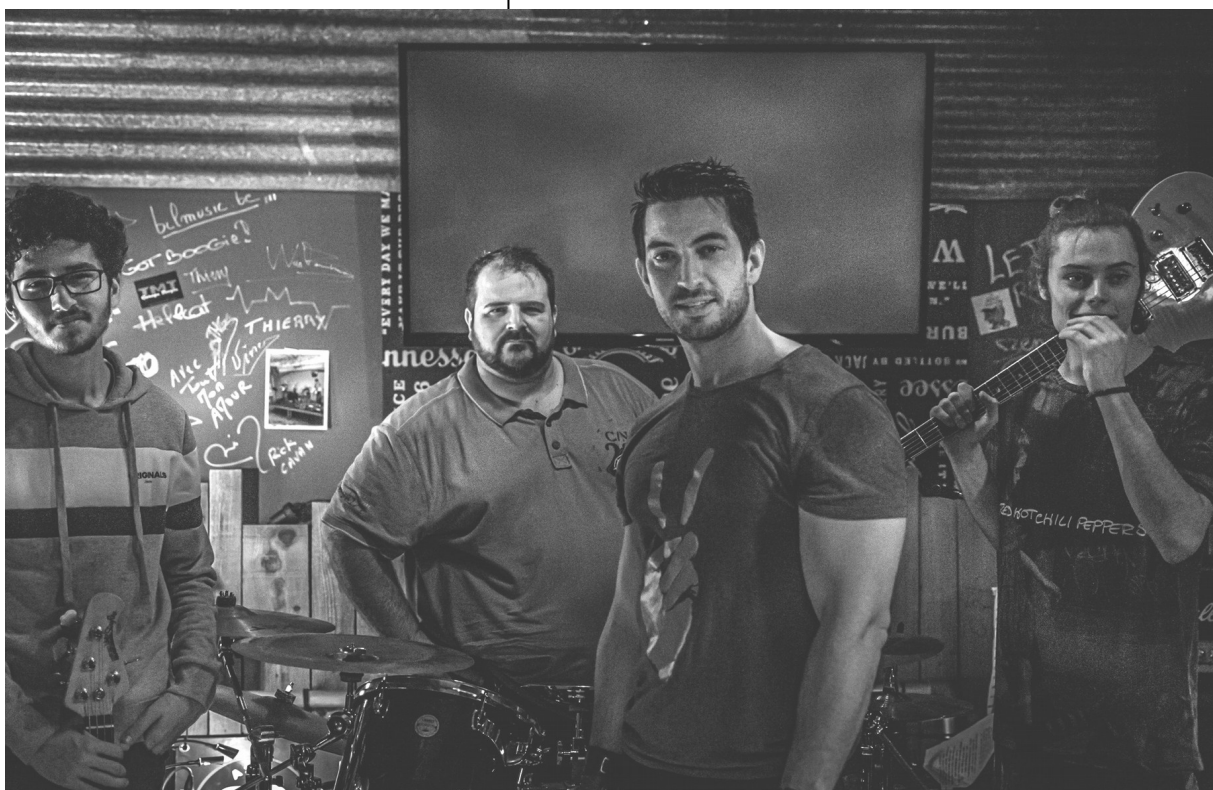
Le groupe PLUG IN VITRO animera la soirée du 09 Août.

Fidèle à une habitude bien ancrée dans la vie festive de la commune, le Groupe des animateurs Trélonais mettra cette année encore « Trélon en Folie » les samedi 08 et dimanche 09 Août.