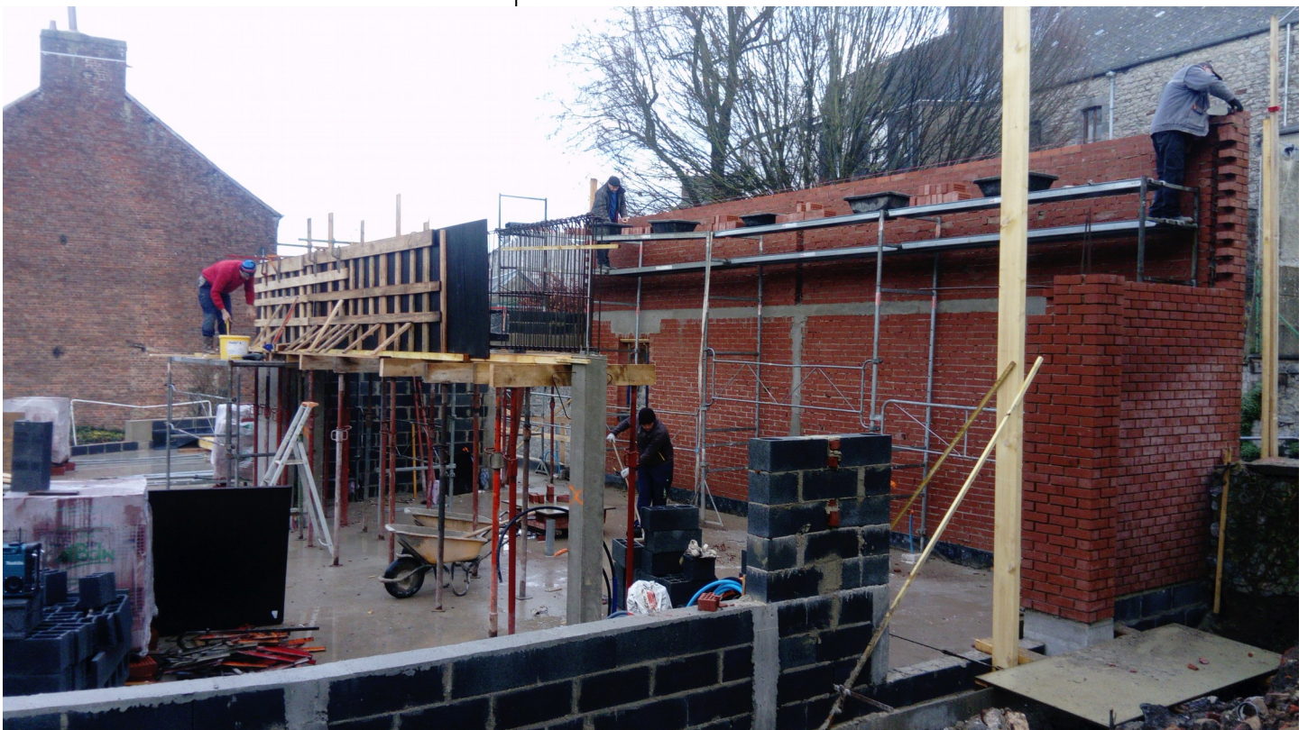
La construction du nouveau restaurant scolaire, rue Thiers, avance normalement.